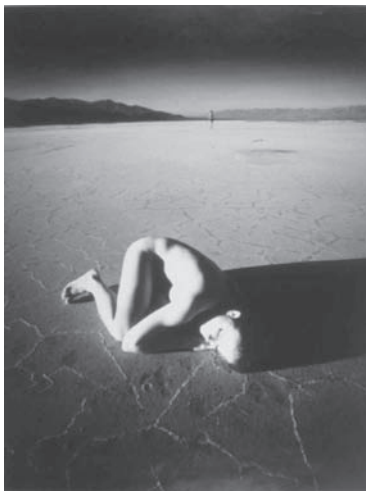
Kishin Shinoyama / Galerie du Château d'eau - Toulouse

:: Rennes (35) : jusqu'au 06/01, Jean-Louis Saïz « l'autre voyage », Les Champs Libres, cours des alliés.