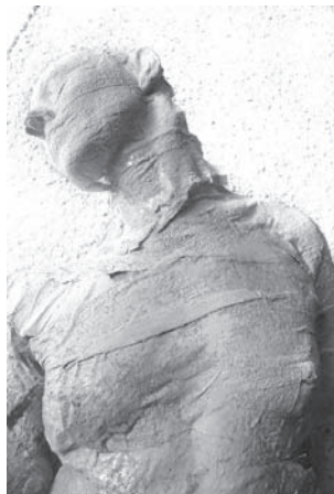
B.Pilia / exposition Fany Alloing

:: St-Brévin (44) : du 12/12 au 7/01, Emmanuel Bazin , salle des roches.