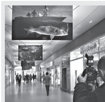
E. Donfut par N. Wernimont

:: Blain (44) : du 11 au 30/06, Quinzaine de la Photo de Blain », organisée par l'association Esphomorana, au château de la Groulais.