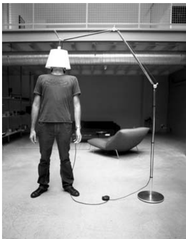
Collectif Il pleut encore

DOL DE BRETAGNE (35) : du 5/06 au 27/06, Mois de l'Image (« l'eau, les hommes » - organisation D.P.I.)