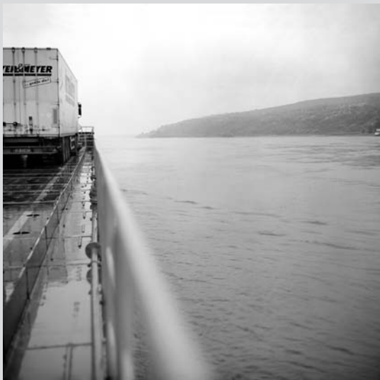
Extrait de l'exposition « Un long fleuve tranquille », dans le cadre de la Biennale Photo 2008 « Le fleuve, transport et communication »

Ils présenteront en 2010 le résultat d'un travail au sein de différents peuples d'Amérique (Inuit, Navajo, Maya et Quechua)