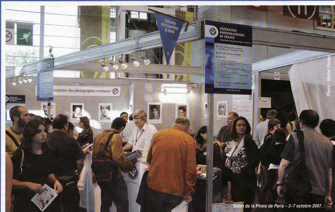
Salon de la Photo de Paris - 3-7 octobre 2007.